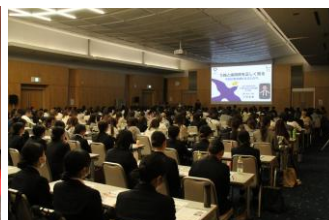
▲ギッシリと埋め尽くされた講演会風景。各講演会とも大盛況にて終了いたしました。