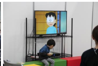
▲キッズコーナーではアニメ動画を上映。お子さまも和んでくれて楽しそうでした。