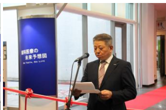
▲弊社社長、開会のご挨拶。