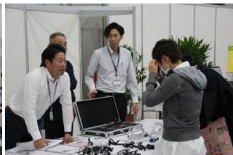
▲比較体感コーナーでは、ポータブルユニット、ポータブルレントゲンや双眼ルーペ、超音波スケーラー、光重合器等、各社製品を手に取って比較してご体感いただきました。