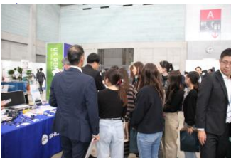
▲予防歯科製品のブースには多くのスタッフ様に関心を寄せられていました。