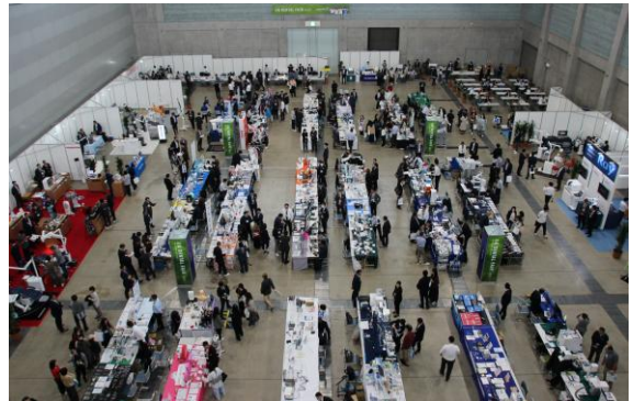
▲2,106平方メートルの展示ホールに、メーカー82社の展示ブース、特設コーナーや比較体感コーナー、休憩コーナー、キッズコーナーを設営。通路も広々とゆとりをもって展示ブースを視察いただきました。