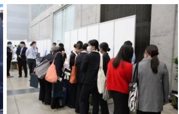
▲UK オリジナル製品を一挙展示した UK コーナーにも、多くの先生や歯科衛生士様、歯科助手様にお越しいただきました。