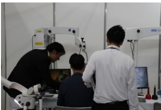
▲特設コーナーでは、展示時間を区切り、口腔機能低下症関連機器、口腔内カメラ、マイクロスコブ、エンドモーター、Ni-Ti ファイル、IOS スキャナ一等、触れてご体感いただきました。