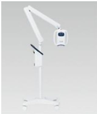
標準価格=本体一式 555,000円