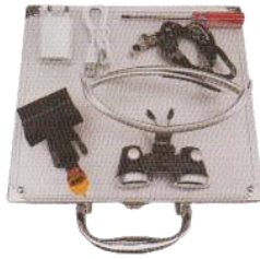
標準価格=本体一式（ケース付） 29,800円