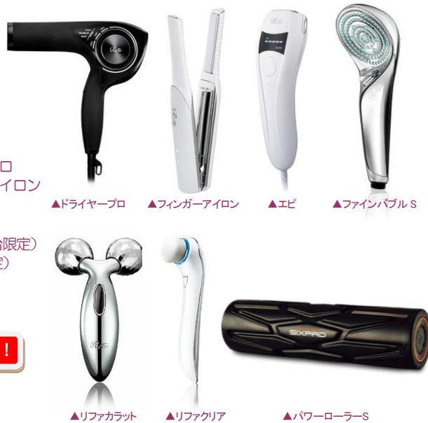
▲ドライヤープロ ▲フィンガーアイロン ▲エビ ▲ファインパルスS