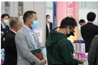
▲話題の新製品はそのでチェック！手に取ってじっくりご体感いただきました。