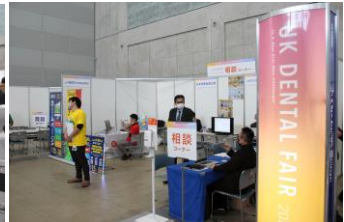
▲相談コーナーでは、専門企業様のご協力により新規ご開業やリニューアルの設計、融資のご相談、ホームページ制作等のご提案をさせていただきました。