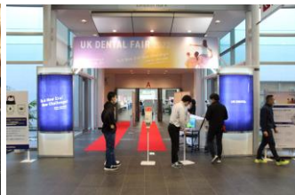
▲会場入り口には、感染予防対策の一環として、サーモグラフィカメラによる検温を実施いたしました。