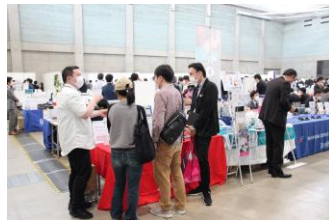
▲担当営業マンがしっかりエスコート！お得意様と一緒に様々なブースを同行しました。