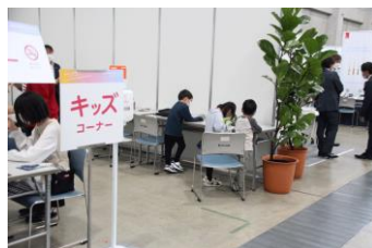
▲キッズコーナーでは、感染対策を考慮し、遊んだおもちゃはお持ち帰りとしてプレゼントしました。