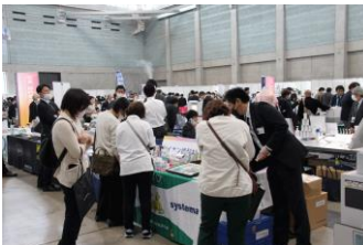
▲予防製品のブースには、多くの歯科衛生士様、歯科助手様にお越しいただきました。