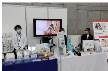
▲UKコーナーではオリジナル製品の数々と、当社がおススメする製品を展示。人気コーナーの一つでした。