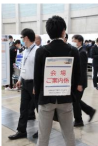
▲会場内の至る所にご案内係を配備し、会場内をご案内いたしました。