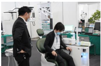
▲最新の診療用ユニットに腰掛けていただき、座り心地をご体感いただきました。