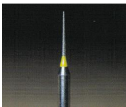
標準価格＝1ケース（5本入）3,900円