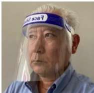
▲フェイスシールド着用イメージ

※さらにオパールエッセンス BOOST™ のバイシエントキット、またはリフィルのいずれかをご購入いただきますと、初回購入に限り、フェイスシールドセット (10 枚入) をご提供させていただきます。尚、フェイスシールドご提供は数量に限りがございますことをご承知ください。詳細につきましては弊社営業担当者までお尋ねください。