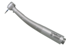
タービンハンドピース LUNASUS1