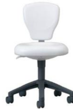
Dr ツール モア Nr