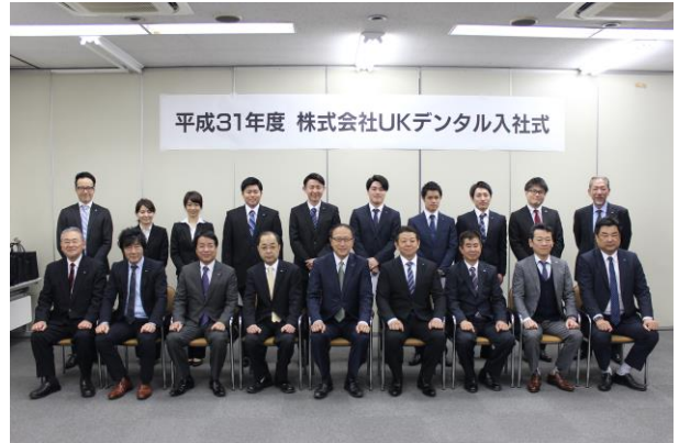
▲弊社役員ならびに人事部との合同写真。

▲『本日はあとひと月で元号が変わり、平成最後の新入社員入社式であり、また当社100周年を迎える年に入社する皆さんは記憶に残る社員となるでしょう。また、皆さんは当社に人事部ができて初の新入社員。内定辞退もなく今日を迎えられたことを嬉しく思います。これから皆さんは互いに同期として、またよきライバルとして助け合い、競い合いながら成長してほしい。そしてこれから、皆さんと一緒に101年目の歴史を作っていきます。』と社長より挨拶。