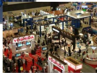
2018九州デンタルショー来場者数