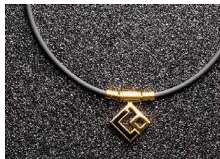
標準価格=コラントッテ TAO AURA プレミアムゴールド 22,000円+税 サイズ=M(43cm)、L(47cm)、LL(51cm)

京セラ宝飾部との業務提携にて、磁気健康ギア「Colantotte（コラントッテ）」製品を継続的に取り扱っておりますが、この度、WBC 侍ジャパン選手団の着用で人気急増の“コラントッテ TAO AURA プレミアムゴールド”が4月1日に発売されます。今年3月に入りフィギアスケート男子の宇野選手や女子プロゴルフ2年連続賞金女王の伊・ボミ選手の契約情報で、益々人気沸騰のコラントッテ製品です。子供の日や母の日、父の日の贈呈に、またはご自身の健康ギアとしてこの機会にご用命ください。その他にも数々のコラントッテ製品を取り扱っておりますので、お気軽に弊社営業担当者にお尋ねください。