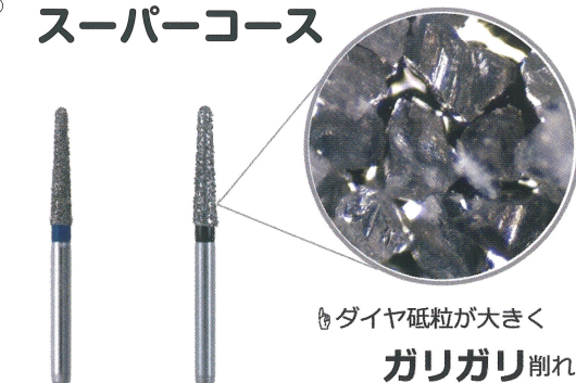
スタンダード スーパーコース

スタンダードよりも大きなダイヤモンド粒子を使用しているダイヤモンドです。ジルコニアの除去に効果的です。