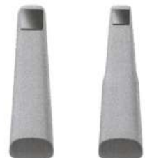
スタンダード ミニ 16×12mm 12×9mm

大人・子供に合わせて2種類のスキャナチップをご用意。スキャナチップはオートクレーブ滅菌100回まで対応。