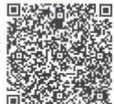
口腔内レポート (QRコードサンプル)